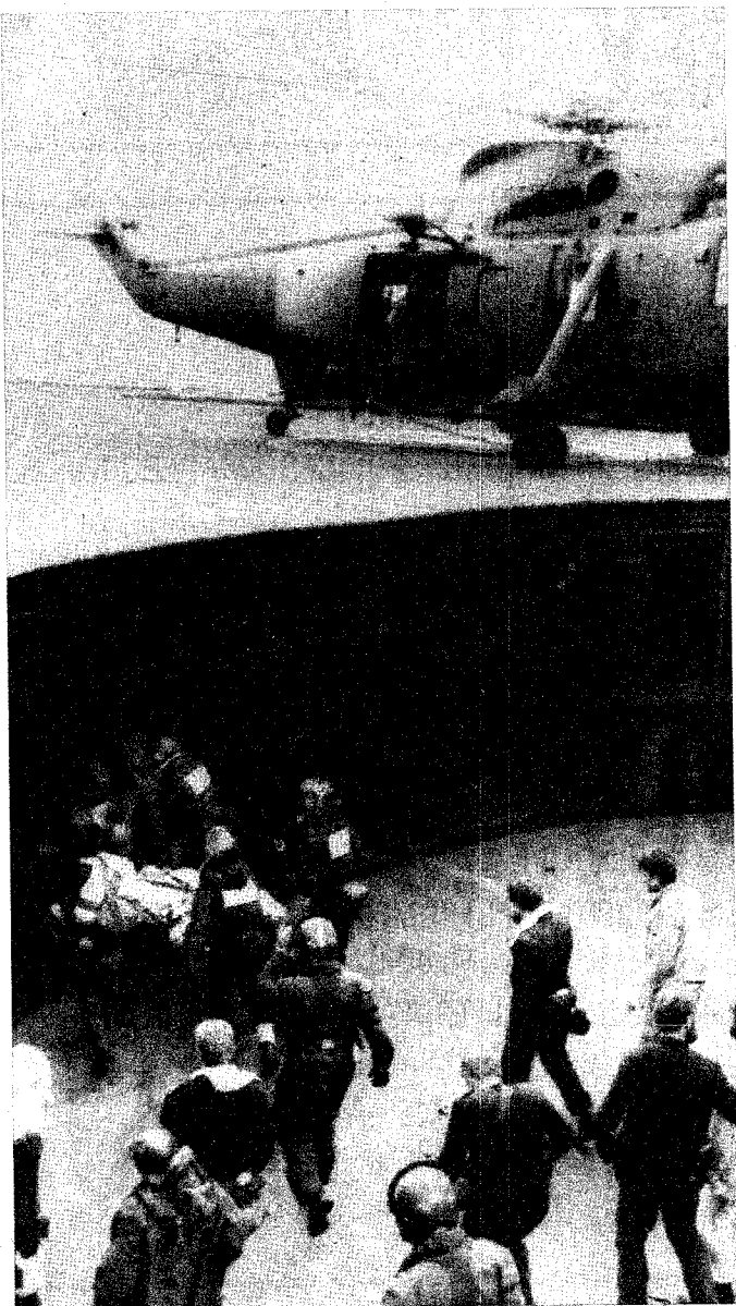
Tripulantes del hundido «Sheffield», algunos en camilla, llegan a bordo del «Hermes» en helicóptero

han ido a pique con la nave. La guerra sigue su marcha con elevadas pérdidas por ambos bandos mientras las Naciones Unidas realizan nuevos esfuerzos para tratar de encontrar una solución pacífica. En estas fotos podemos ver algunas escenas de la dramática contienda