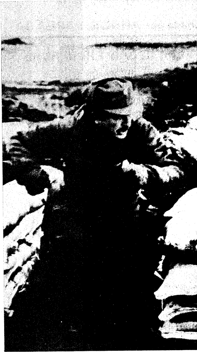
Un soldado argentino abandona por unos momentos la trinchera en la que se encuentra en un lugar indeterminado de las Malvinas