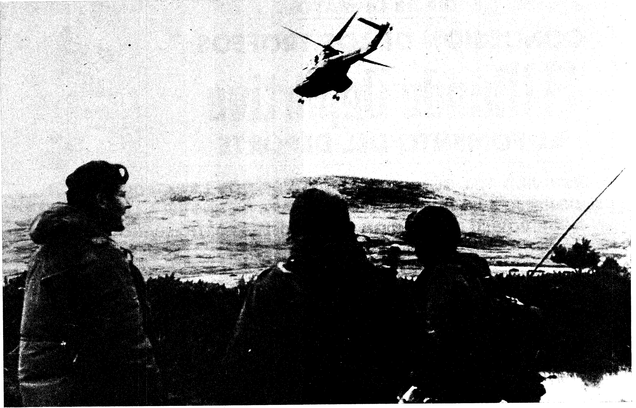
Una patrulla argentina en las Malvinas contempla un helicóptero que parte en busca de posibles comandos enemigos infiltrados en las islas

A pesar del avance británico, los argentinos han conseguido infligir a su marina un duro golpe hundiendo el destructor «Coventry», gemelo del «Sheffield», hundido en días pasados, y el buque de transporte «Atlantic Conveyor», en el cual iban embarcados varios aviones «Harrier», que se